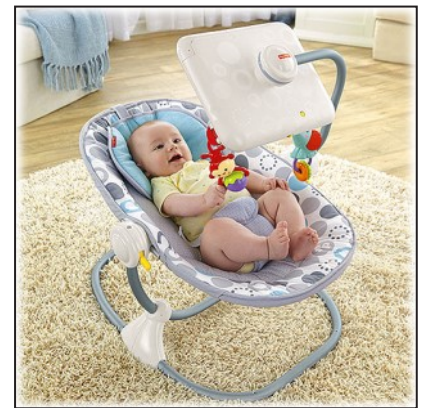
Abb. 3: Ein iPad in einer Babyrassel. Es sei an dieser Stelle darauf hingewiesen, dass das Mobilgerät direkt über den Hoden des Jungen platziert ist. Abb. 4: 2-in-1 Töpfchen iPotty mit iPad-Halterung. Abb. 5: iPad zur Unterhaltung eines Babys.