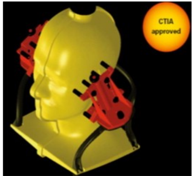
Abb. 2: SAM-Phantomkopf 1

Die Computersimulation ist bereits weiter oben besprochen worden. Die SAM-Messungen werden an einem Phantomkopf aus Kunststoff durchgeführt, der 10% der größten US-Soldaten im Jahr 1989 entspricht. Von jedem Kopf, der kleiner ist als der SAM-Phantomkopf, wird MWS stärker absorbiert (~97% der US-Bevölkerung). [17] Der Phantomkopf wird durch ein Loch von oben mit einer Flüssigkeit gefüllt, die den Absorptionseigenschaften eines Durchschnittskopfs eines Erwachsenen mit seinen 40 verschiedenen Gewebearten entspricht. Ein Roboterarm führt eine elektrische Feldsonde so in das Innere des Phantomkopfs ein, dass die höchsten Werte