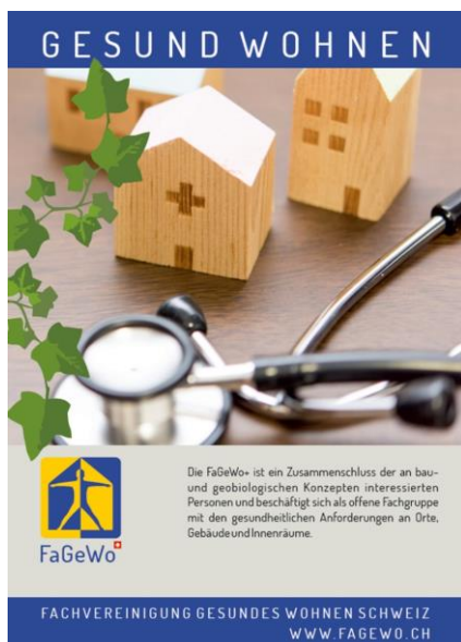
Das Manual „Gesund wohnen“ der FaGeWo+