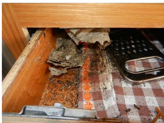
Ameisen im Küchenschrank